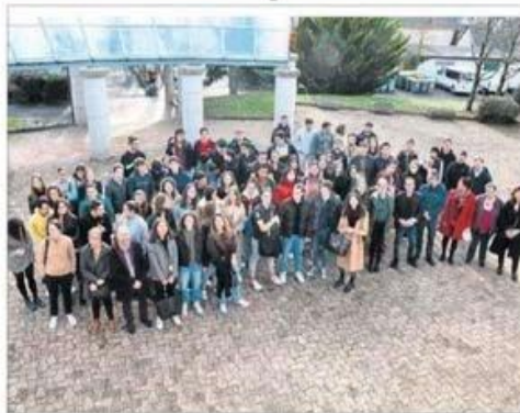
Des anciens élèves du lycée Monteil réunis à l'occasion d'un

Ce vendredi 16 décembre, le lycée Monteil a organisé une journée d'orientation destinée aux élèves de première et de terminale. En début de journée, un forum destiné aux filières technologiques et une rencontre entre les élèves et le tutorat de la faculté de médecine de Toulouse. En début d'après-midi, un forum réunissant des élèves de terminale et une centaine d'anciens élèves