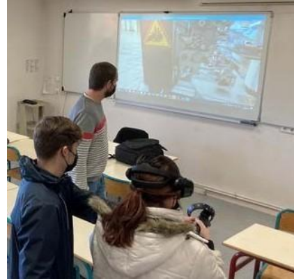
Expérience de réalité virtuelle